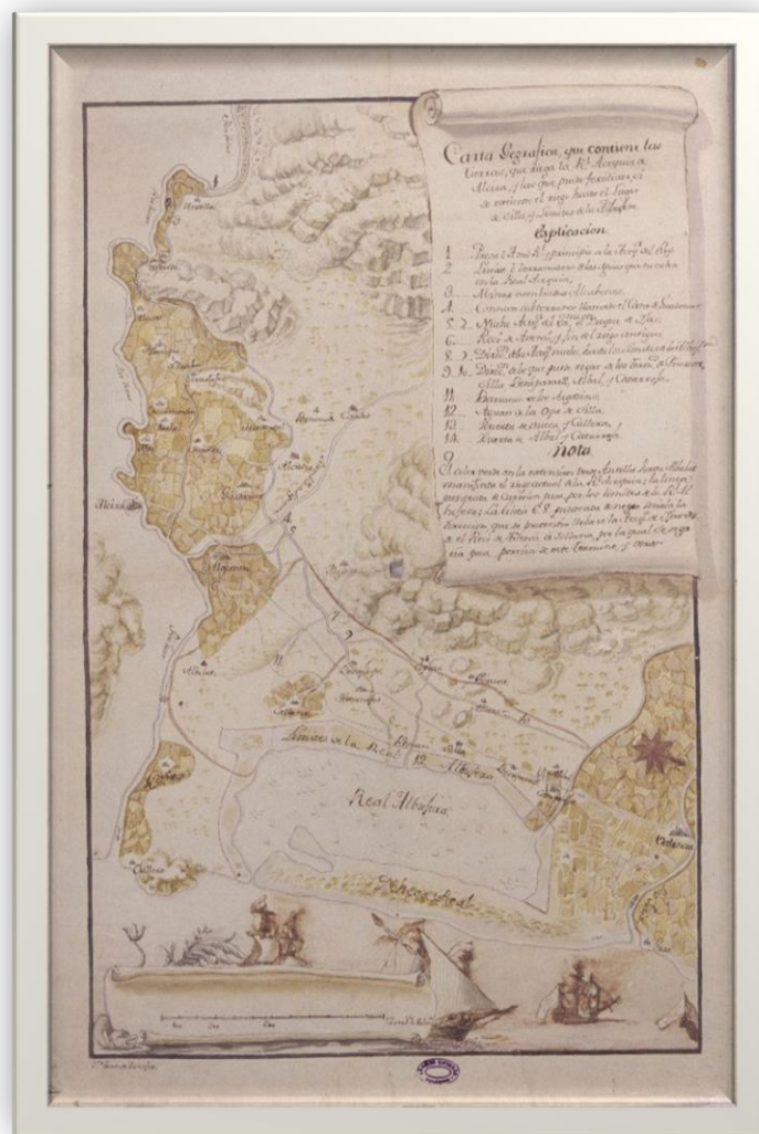
c. 1768. <Carta geográfica que contiene las tierras que riega la Real Acequia de Alcira y las que puede fertilizar si se convierte el riego hasta el lugar de Silla y limites de la Albufera> Archivo Catedral de Valencia. Planos, trazas y dibujos, H.16.7